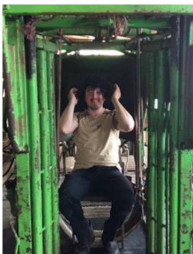
Foto: Fra artiklen i Kvæg september '20 "Du løber hellere ikke maraton i et par gamle træsko"