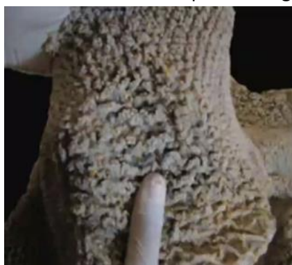
Svagt udviklet vomvæg

Lange vompapiller udviklet i mælkefodringsperioden letter fravæningen. Undersøgelser viser at partikellængden i grovfoder til kalve skal være max 2 cm for at det giver den ønskede effekt på vomudviklingen. Partikler over 2 cm "bøjer af" og er mindre stimulerende på vomvæggen.